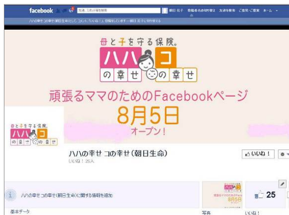
「ハハの幸せ コの幸せ（朝日生命）」ページ イメージ https://www.facebook.com/mamano.omoj

当ページではキャンペーンやコンテスト、 子育てママにお役に立つ情報 を写真など織り交ぜてお届けします。お客様と双方向のコミュニケーションをとりながら、当社からは「子育てママを応援する」メッセージを発信することで、お客様から身近な存在として当社への理解を深めていただけるよう取り組んでまいります。