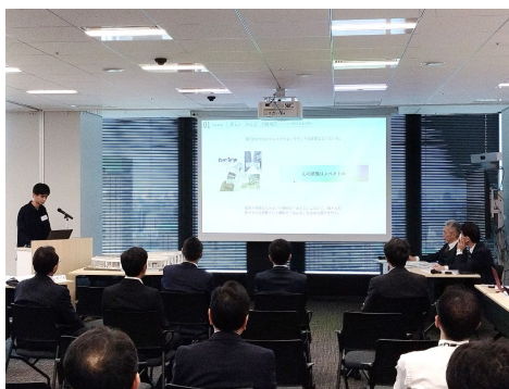
二次審査会の様子

入選された5作品はどれも秀作揃いでした。興味深かったのは、各作品がそれぞれ違う視点でアプローチし、ウェルネスを深く考え、建築と真摯に向き合っている点です。彼・彼女らの熱量を感じるプレゼンテーションも印象的でした。（中山善夫）