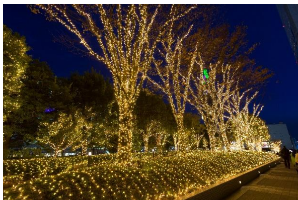
新宿サザンテラス