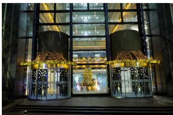
新宿マインズタワー