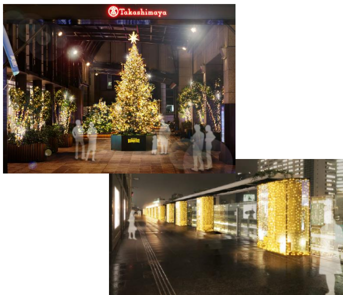
タカシマヤ タイムズスクエア