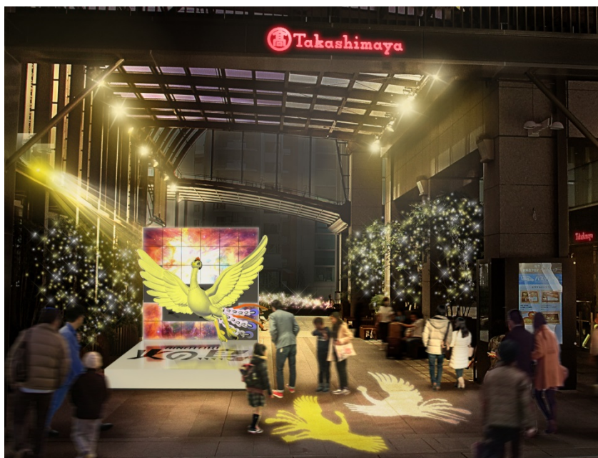
『HINOTORI イルミネーション』※画像はイメージです。