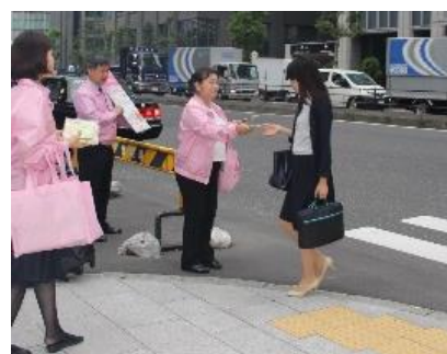
大手町本社付近での配布風景（10/3）