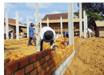
寺子屋建設中の様子

また、「途上国の女性たちが読み書きを学ぶ機会を得て自立し、自分らしく生きていくための支援をしたい」との想いを込めた寄付支援に対し、日本ユネスコ協会連盟より感謝状を拝領いたしました。