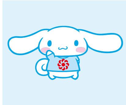
©2001, 2015 SANRIO CO.LTD. APPROVAL No.G560574 シナモロール