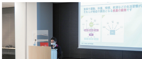
健康セミナー「生活習慣病検査と治療の意義」開催時の様子

公益財団法人としての朝日生命成人病研究所をサポートするだけでなく、当研究所との永年の関係を活かし、附属医院の医師による社内セミナーを通じて、従業員の健康知識の向上、健康意識の醸成を図っています。